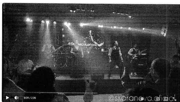
Skaranova Banda Show tocando Capital Inicial em casamento em Itapetininga.